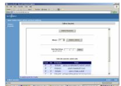
Ecrã onde o próprio utilizador confirma as suas férias e gere as delegações de competências.