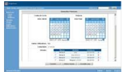
Pool Manual/ Atribuição de Viaturas