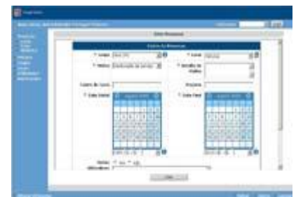
Ecrã de Requisição de Viaturas