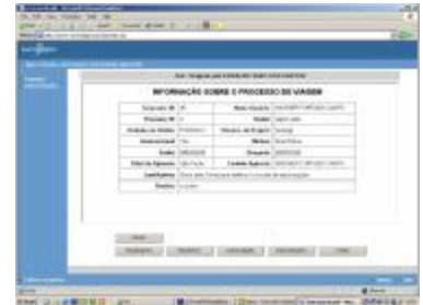
Módulo de autorizações com registo de logs

Para informações adicionais, favor contactar: